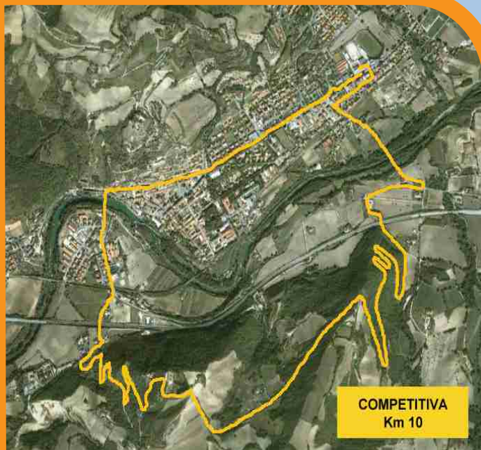
COMPETITIVA Km 10