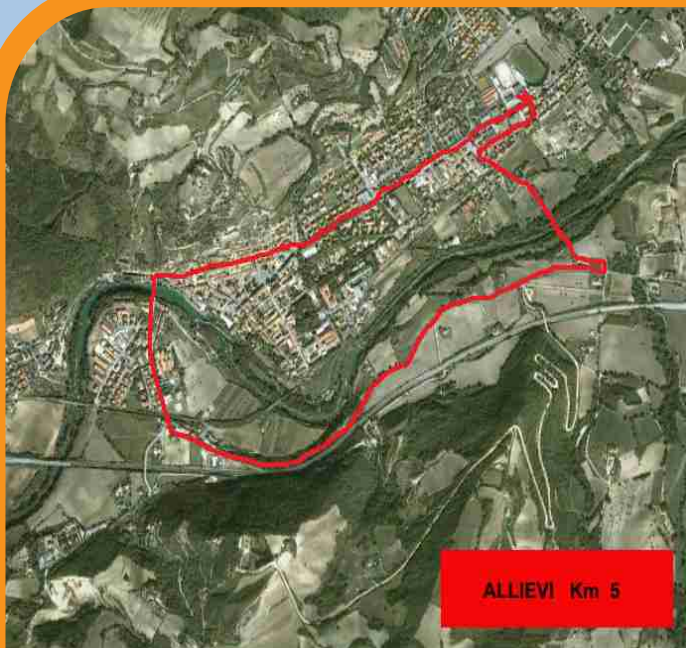
ALLIEVI Km 5